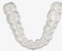
49 min 8 férulas