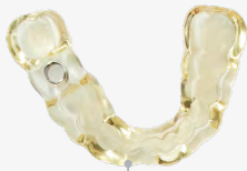
48 min 8 guías quirúrgicas

Velocidades de impresión sin precedentes. Imprime un modelo dental cada 49 segundos.