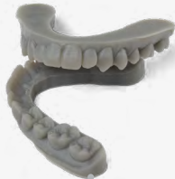
9 min 11 modelos para alineadores transparentes