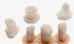
18 min Más de 100 coronas

Una odontología más fácil mediante soluciones innovadoras.